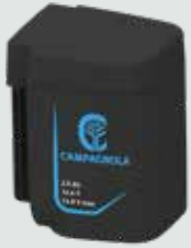
EP1425 2,5 Ah - 14,4 V