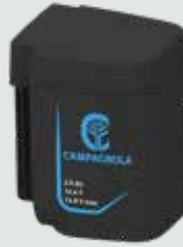
EP2125 2,5 Ah - 21,6 V