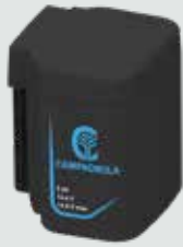
EP1450 5 Ah - 14,4 V