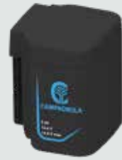
EP2150 5 Ah - 21,6 V